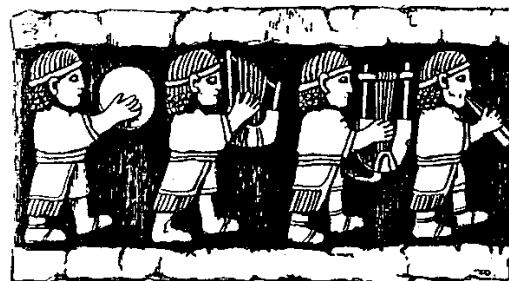
Músics d'un baixrelleu de Karatepe

· La litúrgia [països llatins] segueix la numeració grega, generalment una unitat per sota de l'hebrea. En les obres d'estudi es segueix la numeració hebrea. El Miserere és el Salm 51 (numeració hebrea ) i el 50 (numeració grega ). Veure Apèndix 1:NUMERACIÓ DELS SALMS.